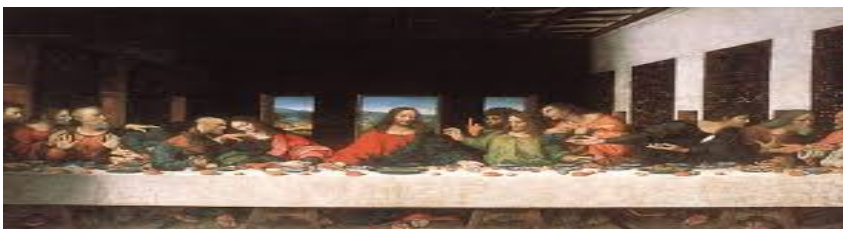
Imagen de la última cena de Leonardo da Vinci, muestra artística del renacimiento. Se pinta cercano a los hombres.

El enfoque de la cultura pasa de ser teocéntrico a ser antropocéntrico, tomando el nombre de movimiento Humanismo. El hombre en primer plano de las ciencias humanas fomenta un individualismo nunca antes experimentado. Este nuevo enfoque dispersa en el mundo un optimismo que, en las ciencias, promueve una curiosidad por el descubrimiento y la belleza, el avance. 7