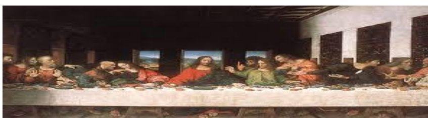
Imagen de la última cena de Leonardo da Vinci, muestra artística del renacimiento. Se pinta cercano a los hombres.

curiosidad por el descubrimiento y la belleza, el avance. 7