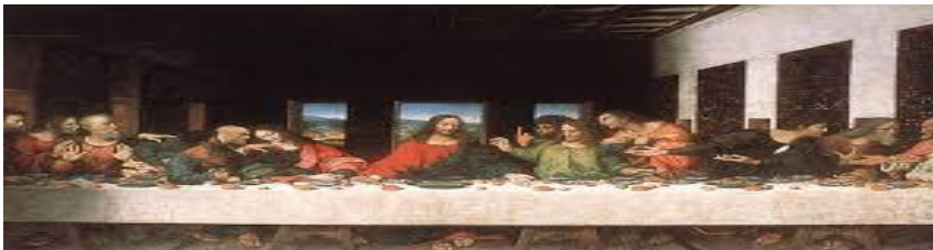
Imagen de la última cena de Leonardo da Vinci, muestra artística del renacimiento. Se pinta cercano a los hombres.

El enfoque de la cultura pasa de ser teocéntrico a ser antropocéntrico, tomando el nombre de movimiento Humanismo. El hombre en primer plano de las ciencias humanas fomenta un individualismo nunca antes experimentado. Este nuevo enfoque dispersa en el mundo un optimismo que, en las ciencias, promueve una curiosidad por el descubrimiento y la belleza, el avance. 7